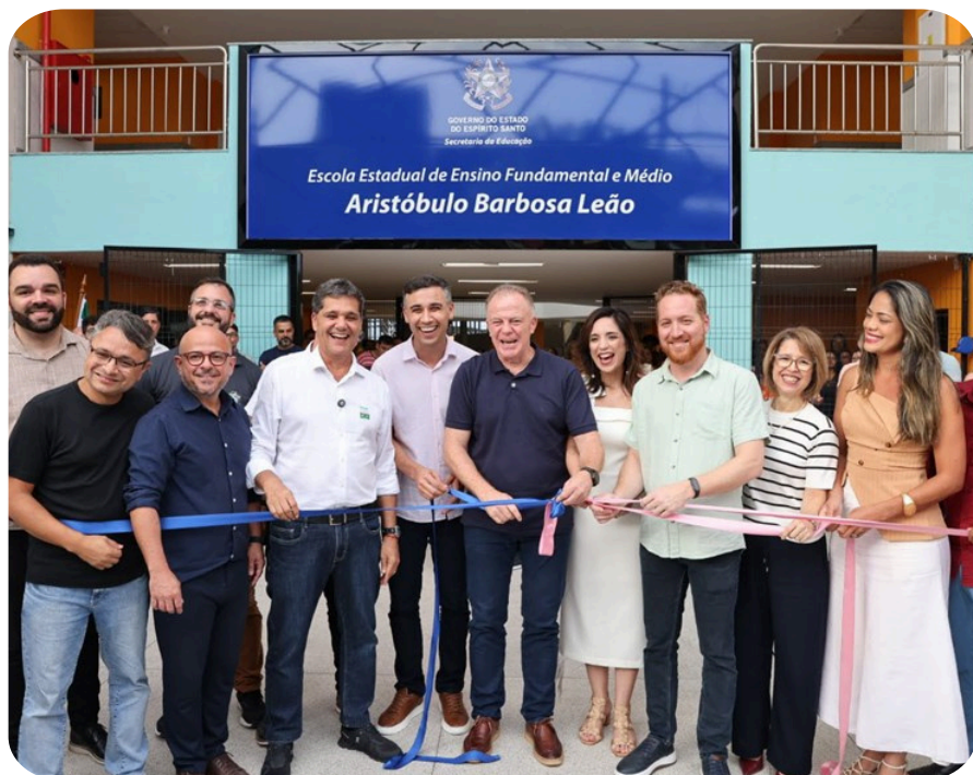
Entrega da nova sede da Escola Aristóbulo Barbosa Leão, na Serra.

As duas obras representam avanços importantes para a Serra, que passa a contar com equipamentos públicos mais compatíveis com seu crescimento urbano e educacional, com impacto direto na rotina de moradores, estudantes e trabalhadores.