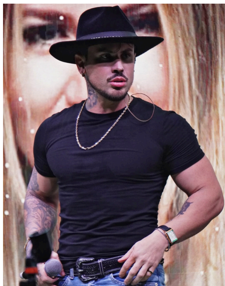
O cantor capixaba Alvaro Nobre.

O cantor capixaba Alvaro Nobre será uma das atrações do Réveillon de Cabo Frio (RJ), uma das maiores festas de Ano-Novo do país, que acontece na Praia do Forte e deve reunir cerca de 1 milhão de pessoas. O artista sobe ao palco principal antes da queima de fogos, em um show de aproximadamente duas horas.