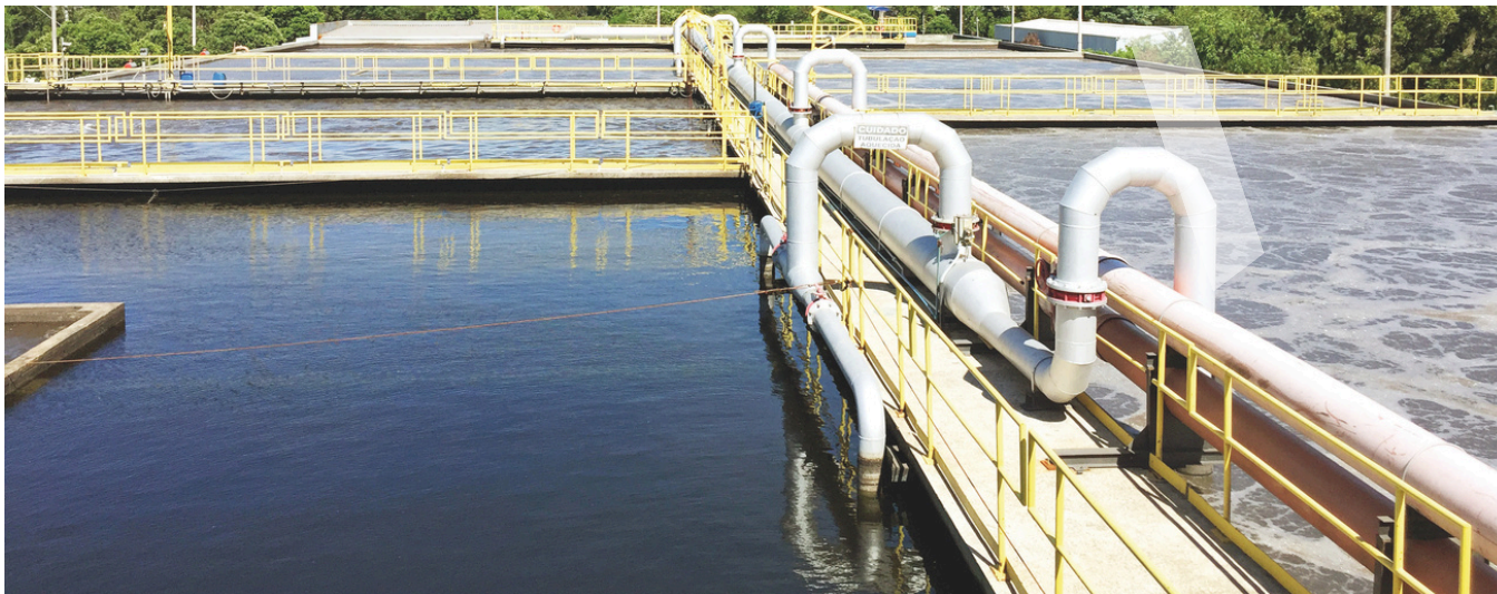
ETE Araças.

No Espírito Santo, a atuação da Aegea ocorre por meio de parceria público-privada com a Cesan, responsável pelos serviços de esgotamento sanitário nos municípios de Serra, Vila Velha e Cariacica.