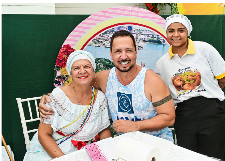
E claro que teve acarajé no Verão VIP, né?