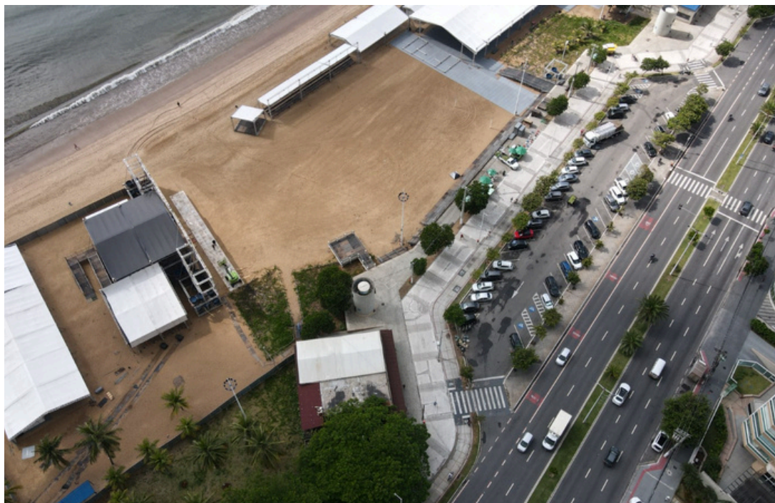
Arena de verão montada na orla de Camburi.

O encerramento da Arena promete casa cheia: Paralamas do Sucesso e Picnic Dogs na sexta (23); Ubando e Latino no sábado (24); e, no domingo (25), Agitu's e Banda Eva fecham a programação. O evento integra cultura, esporte e gastronomia, consolidando Vitória como palco de um dos maiores verões do Espírito Santo.