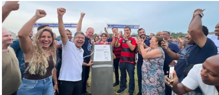
Contorno Augusto Casagrande passa a integrar a ES-115, na Serra.