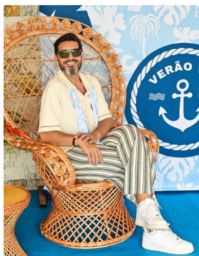
Dam Bianquim .

Confira as fotos de Cloves Louzada e reviva os melhores momentos dessa grande celebração.